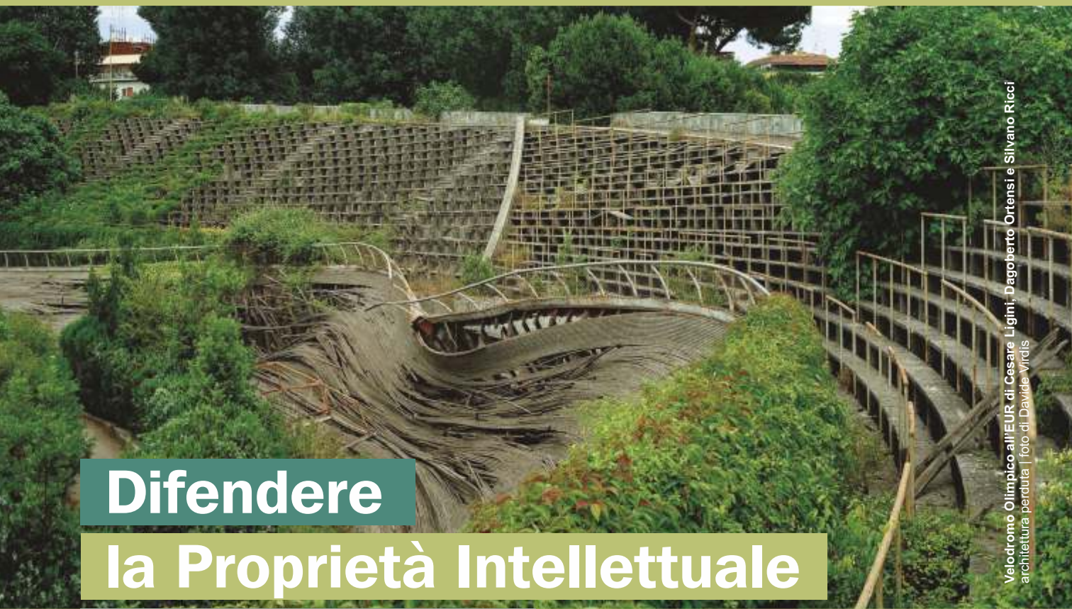
Velodromo Olimpico all'EUR di Cesare Ligini, Dagoberto Ortensi e Silvano Ricci architettura perduta